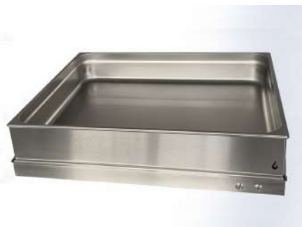
SUPPORT BAC GN2/1