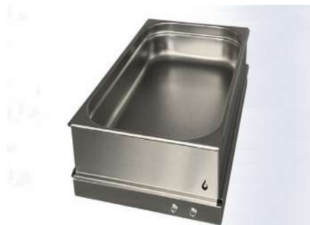
SUPPORT BAC GN1/1

Pour une qualité de travail optimale, optez pour les caches easytemp. Ils vous assurent une meilleure stabilité des bacs gastro et protègent vos plaques.